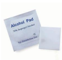
Sachê de álcool isopropílico (x2)

* Veja condições para caixas customizadas com logo e outras cores