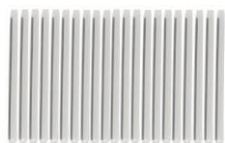
Protetor de emenda (x36)